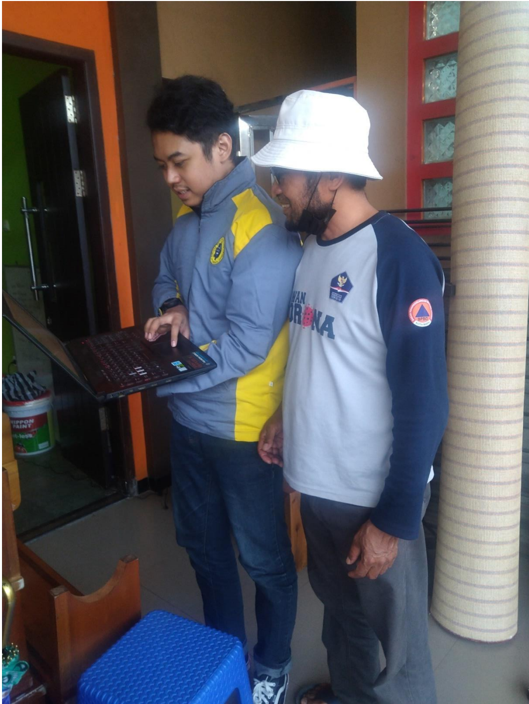
Lampiran 1.3 Survei Ke Ketua Kelompok Tani Gelora Bunga Sidomulyo