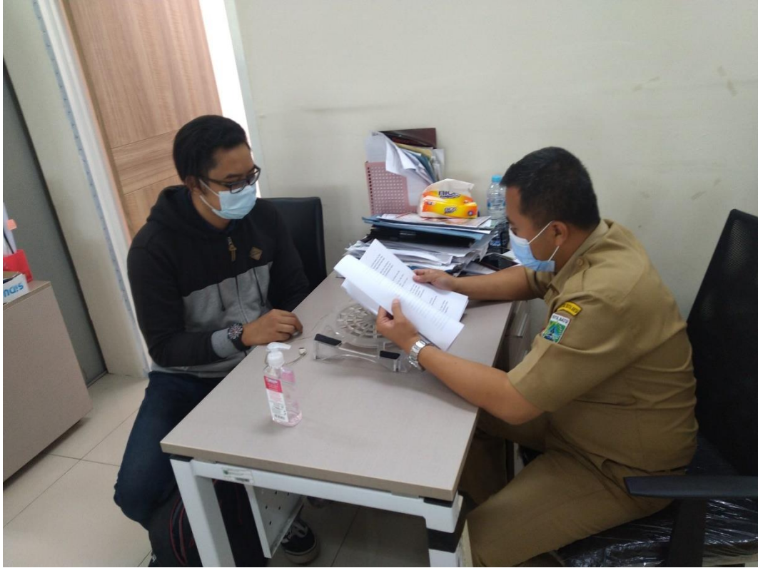
Lampiran 1.4 Pengambilan Data Di Dinas Pertanian Dan Ketahanan Pangan