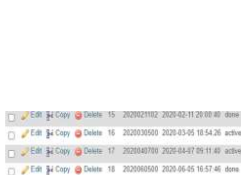
Log Notifikasi pada Sistem