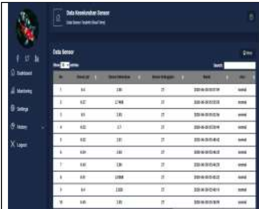
Pembuatan halaman history sistem