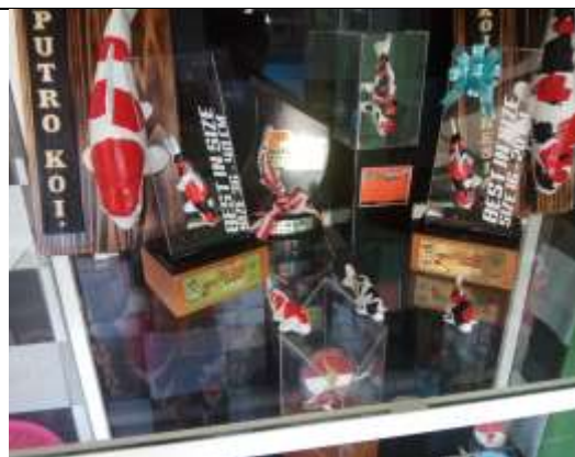
Tempat pengujian kolam koi