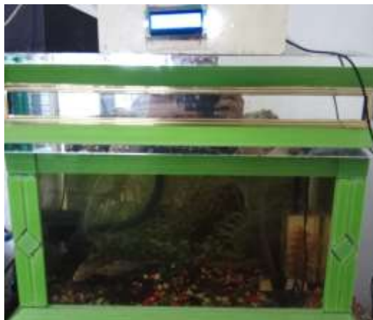
Capture alat pada aquarium