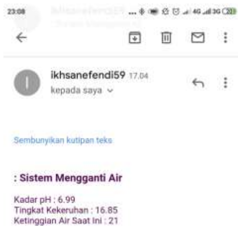
Pengiriman Notifikasi Email