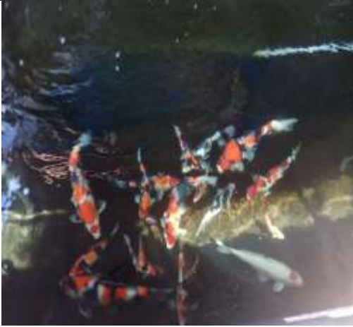
Ikan yang ada di kolam “Putra Koi Center”