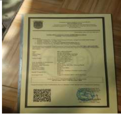
Dokumen hak cipta nama budidaya ikan koi