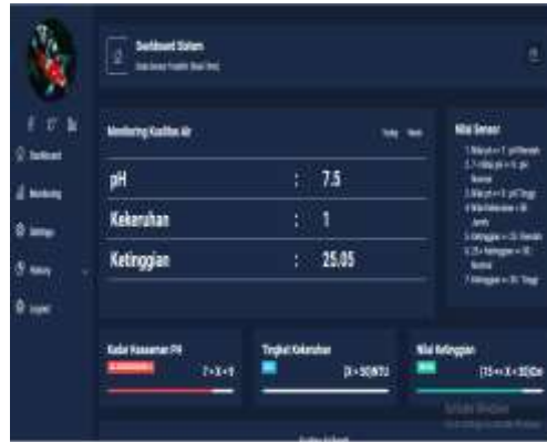
Pembuatan halaman dashboard sistem