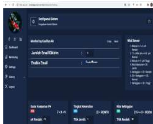
Pembuatan halaman setting sistem