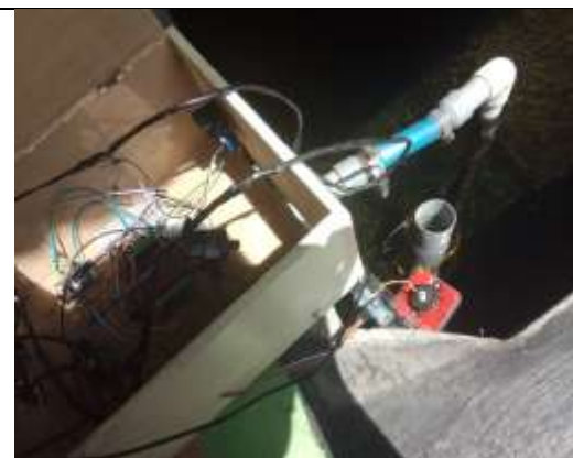
Capture hardware pada kolam koi