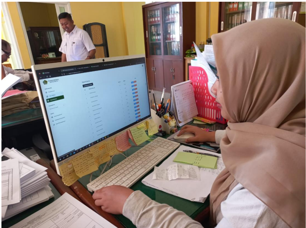
Lampiran 3 Dokumentasi pengujian sistem